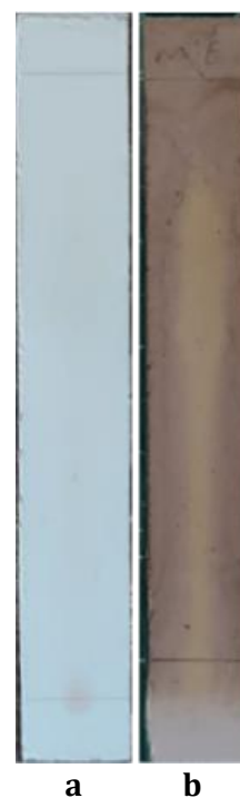
Gambar 3. (a) Pengamatan sinar tampak, (b) Pengamatan sinar tampak setelah disemprot DPPH.

Hasil Elusi fraksi etanol dari akar bajakah dengan fase gerak Etil Asetat : Metanol (1:3) dilakukan uji aktivitas antioksidan dengan disemprotkan DPPH.