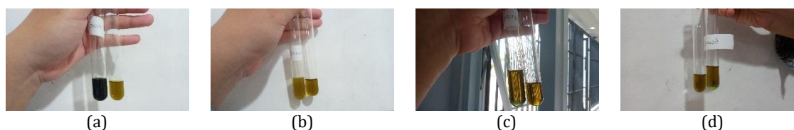
Gambar 2. (a) Identifikasi Tanin (b) Identifikasi Saponin (c) Identifikasi Triterpenoid (d) Identifikasi Steroid